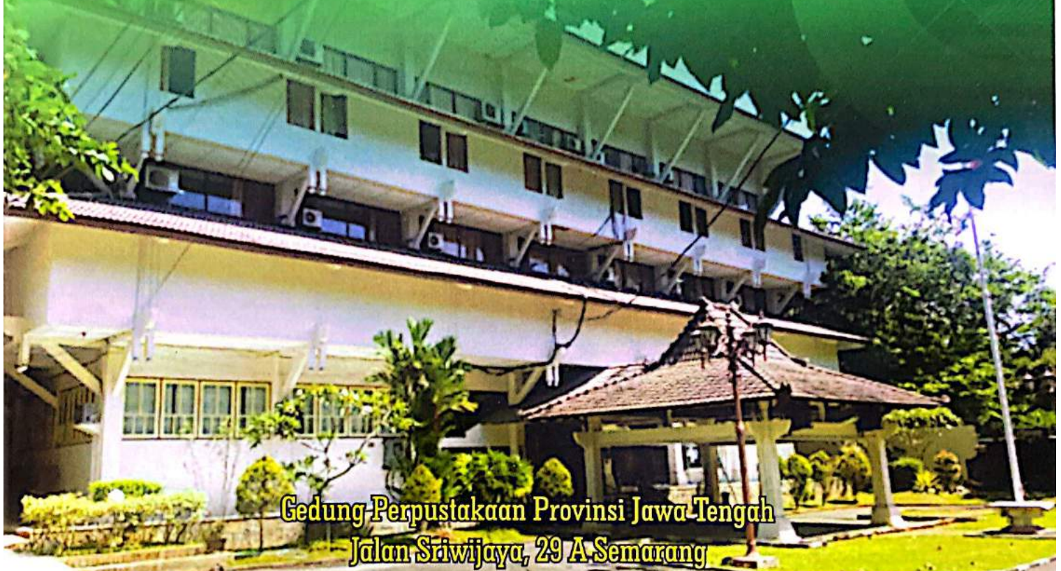
Gedung Perpustakaan Provinsi Jawa Tengah Jalan Sriwijaya, 29 A Semarang